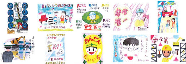
こどもたちが書いた安全ポスター

従業員や協力会社社員の子供から、安全をテーマに新型コロナウイルスや、その他健康に関して、ポスターを作成していただき、会社内のあらゆるところに掲示しています。これまでに60名にのぼる皆さんの子供が書いたポスターを来訪者をはじめ全従業員が真剣に見つめ、安全・健康について改めて認識してくれています。